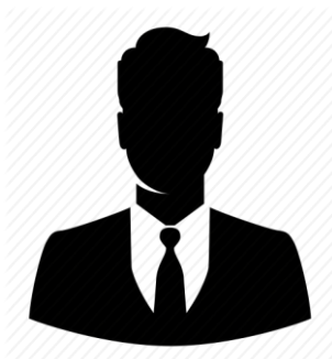
प्रतिनिधि सदस्य (स्थानीय उद्योग वाणिज्य संघ)