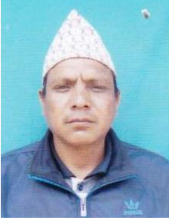
रुपधन कामी सदस्य (वडा सदस्य)