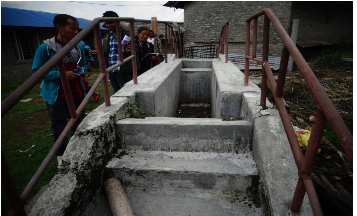
क्षेत्रीय कृषि अनुसन्धान केन्द्र लुम्ले पोखरामा भ्रमण टोली