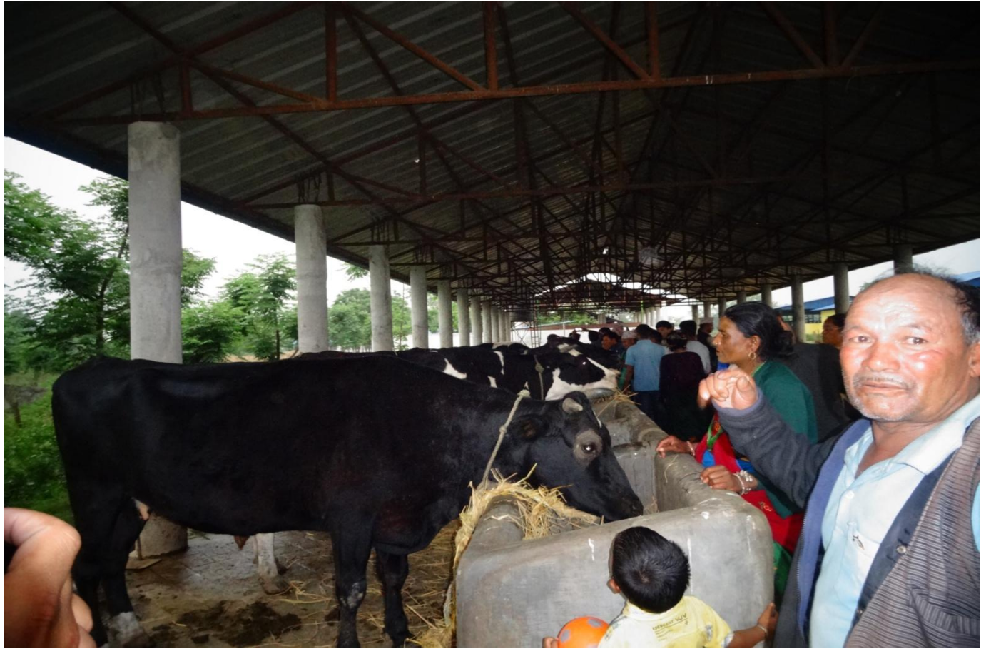
कालिका मानवज्ञान माविको विद्यालय भवन