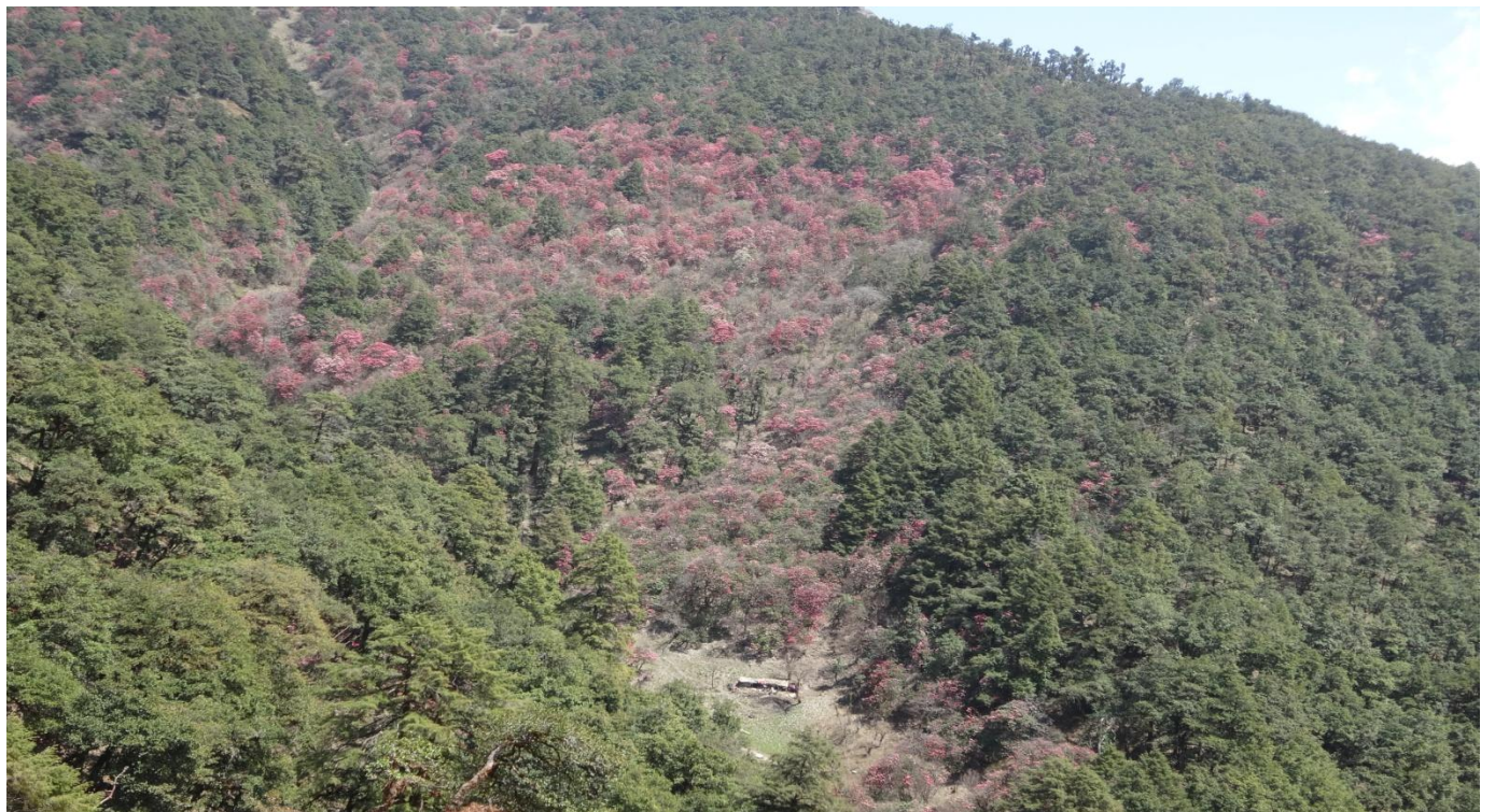
बाग्लुङको बुर्तिवाङ बजार तथा माछा पालन केन्द्र बडिगाड गाउँपालिका ६ एकलेखेत