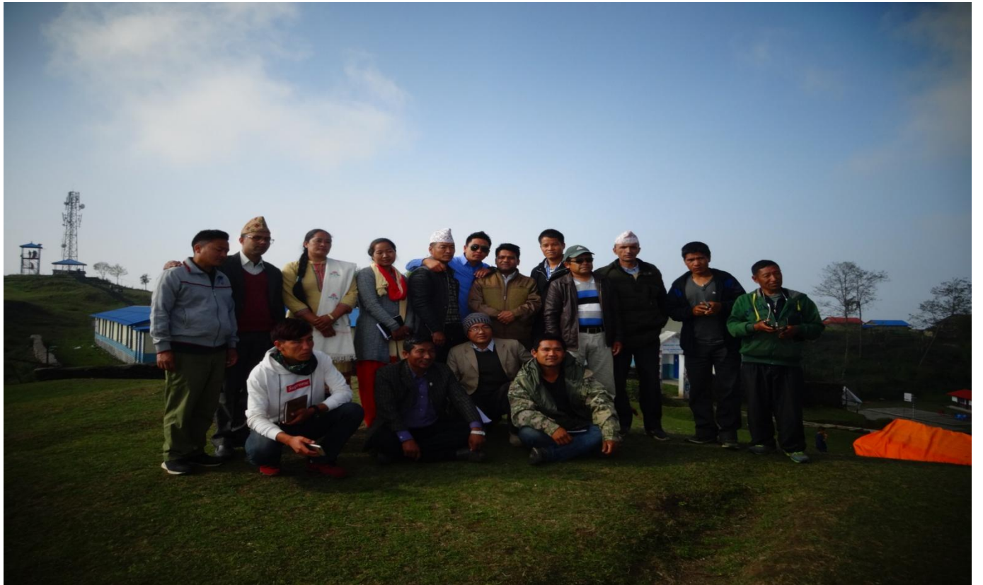
सार्क भिलेज पर्यटन संग्रहालय क्वहोलासोथार गा.पा. ३ घलेगाउँ लम्जुड