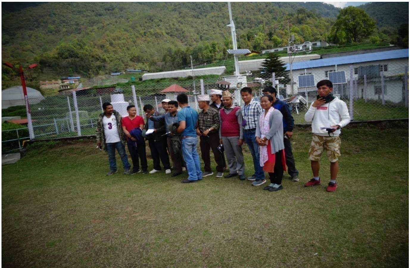
क्षेत्रीय कृषि अनुसन्धान केन्द्र लुम्ले कास्की