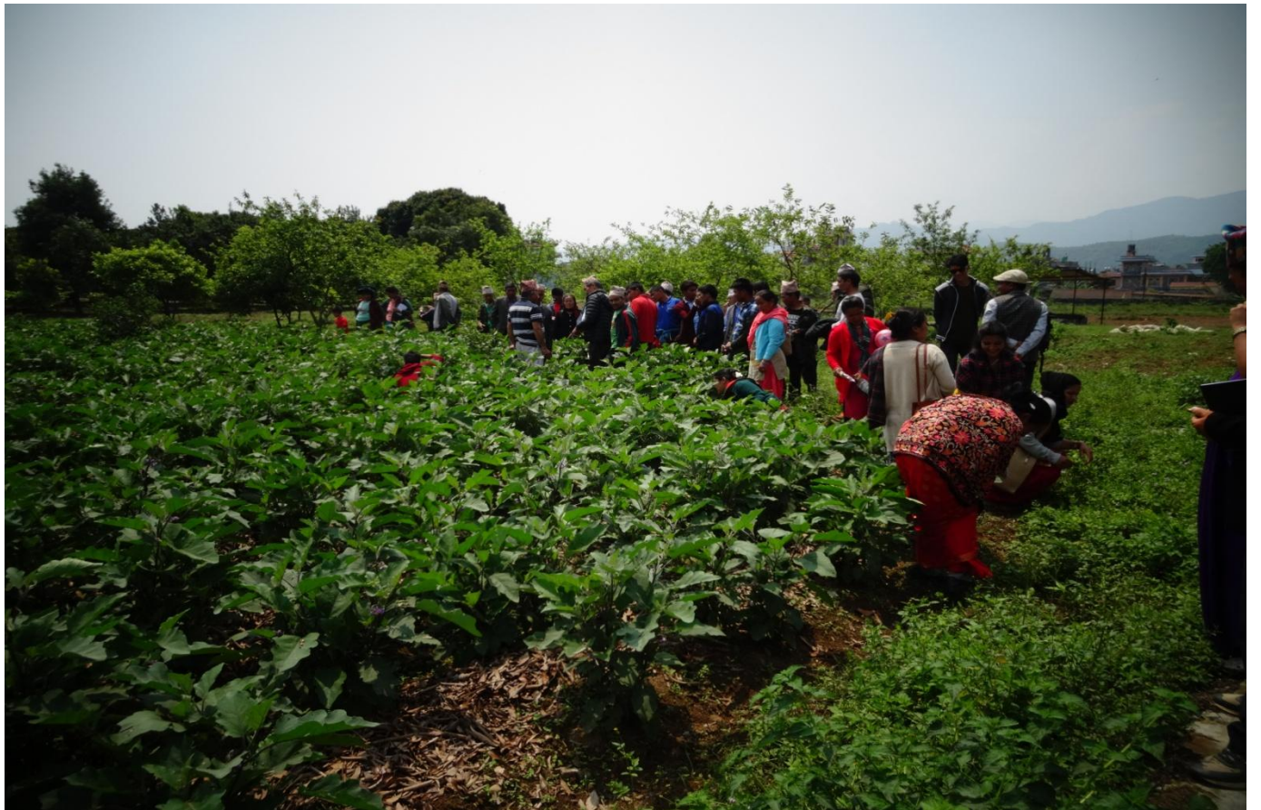
सार्क राष्ट्रकै पर्यटकिय नमूना भिलेज घलेगाउँ