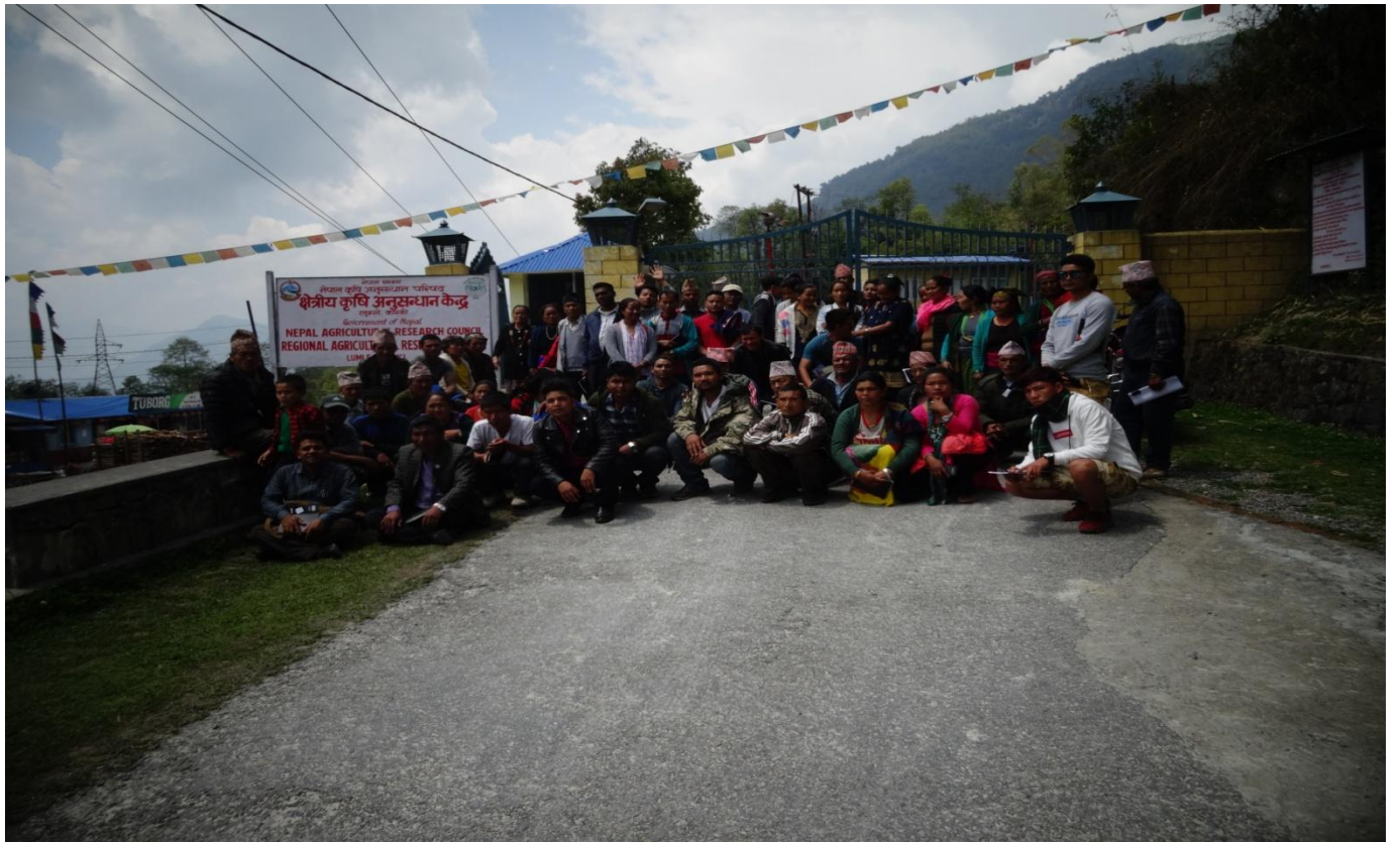
उत्कृष्ट सामुदायिक विद्यालय बालमन्दिर मावि नदिपुर पोखरा