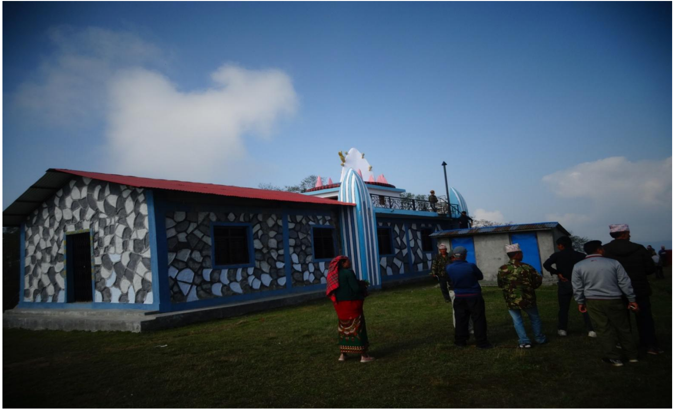
मत्स्य विकास केन्द्र तथा मौरी विकास कार्यक्रम भण्डारा चितवन