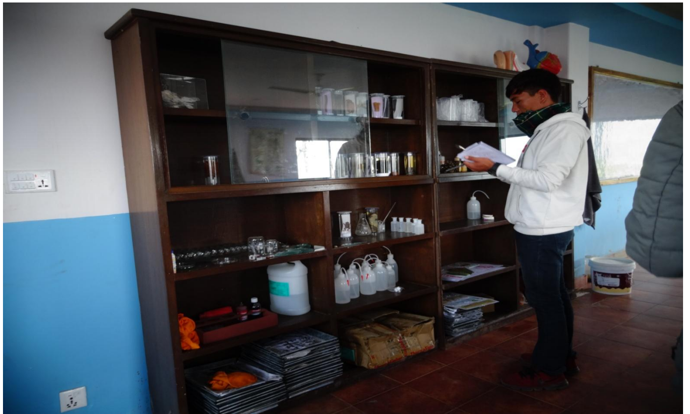
बागवानी अनुसन्धान केन्द्र मालेपाटन पोखरा