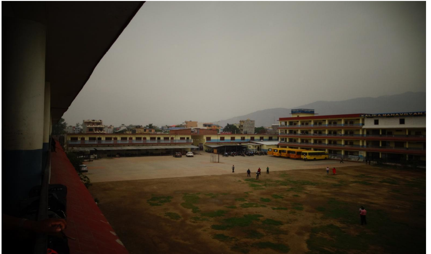
कालिका मानवज्ञान माविका वाल विकासका कक्षाहरु