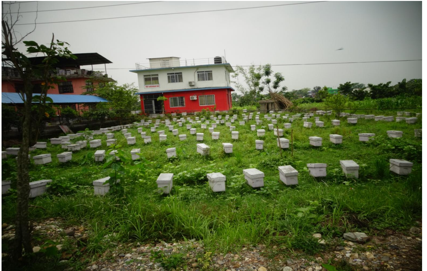
मकै वाली अनुसन्धान केन्द्र र गाई अनुसन्धान केन्द्र रामपुर चितवन