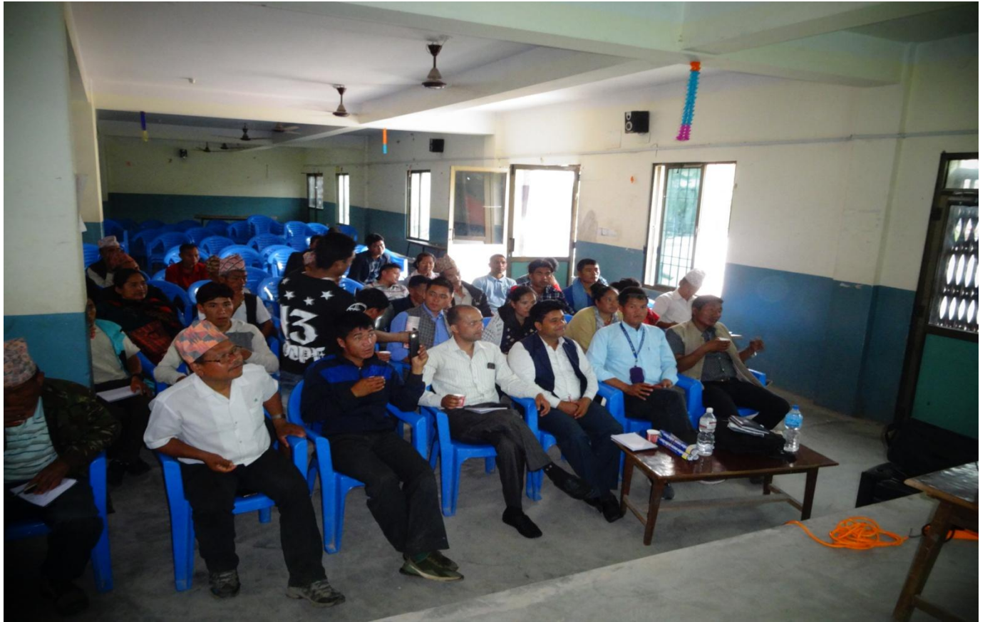
गौतम बुद्धको जन्म स्थल लुम्बिनी क्षेत्र