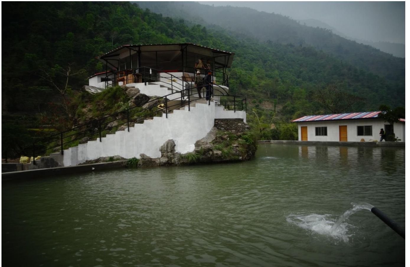
क्षेत्रीय कृषि अनुसन्धान केन्द्रमा शिक्षाको टोली